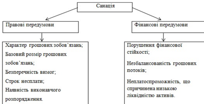
Рис. 1. Умова необхідності проведення санації на підприємстві

На нашу думку, запропонований підхід для визначення необхідності проведення санації – дієвий, оскільки поєднує в собі фінансові та законодавчі аспекти, які своєю чергою створюють систему, яка найбільш повно та ефективно розкриває доцільність проведення санації.