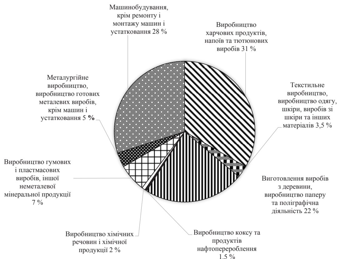
Рис. 2. Структура виробництва продукції переробної промисловості Волинської області

Спираючись на статистичні дані, проаналізуємо динаміку виробництва основних видів продукції за останні роки (табл. 1).