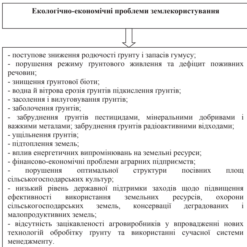
Рис. 2. Основні екологічно-економічні проблеми землекористування в Україні

У зв'язку з порушенням наукового принципу розміщення посівних площ (залежно від крутизни схилу та попередників) не можуть бути забезпечені оптимальні умови для розвитку рослин, неможливо уникнути процесів деградації ґрунтів, що