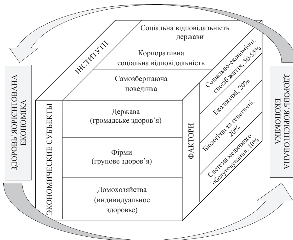
Рис. 2. Концептуальна модель ЗОЕ