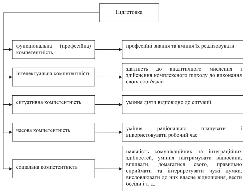
Рис. 4. Варіативність розгляду блоку «Підготовка» у схемі реалізації компетентнісного підходу на підприємствах торгівлі