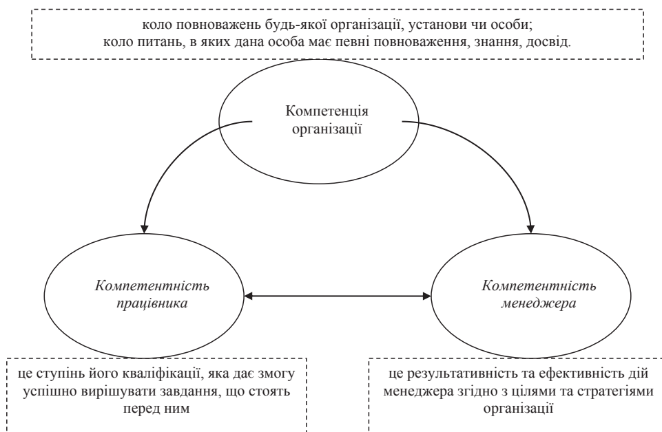
Рис. 1. Трьохсторонній взаємозв'язок компетентностей