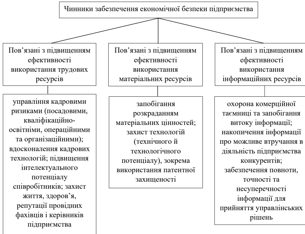
Рис. 2. Чинники забезпечення економічної безпеки за напрямками забезпечення економічної безпеки на підприємстві