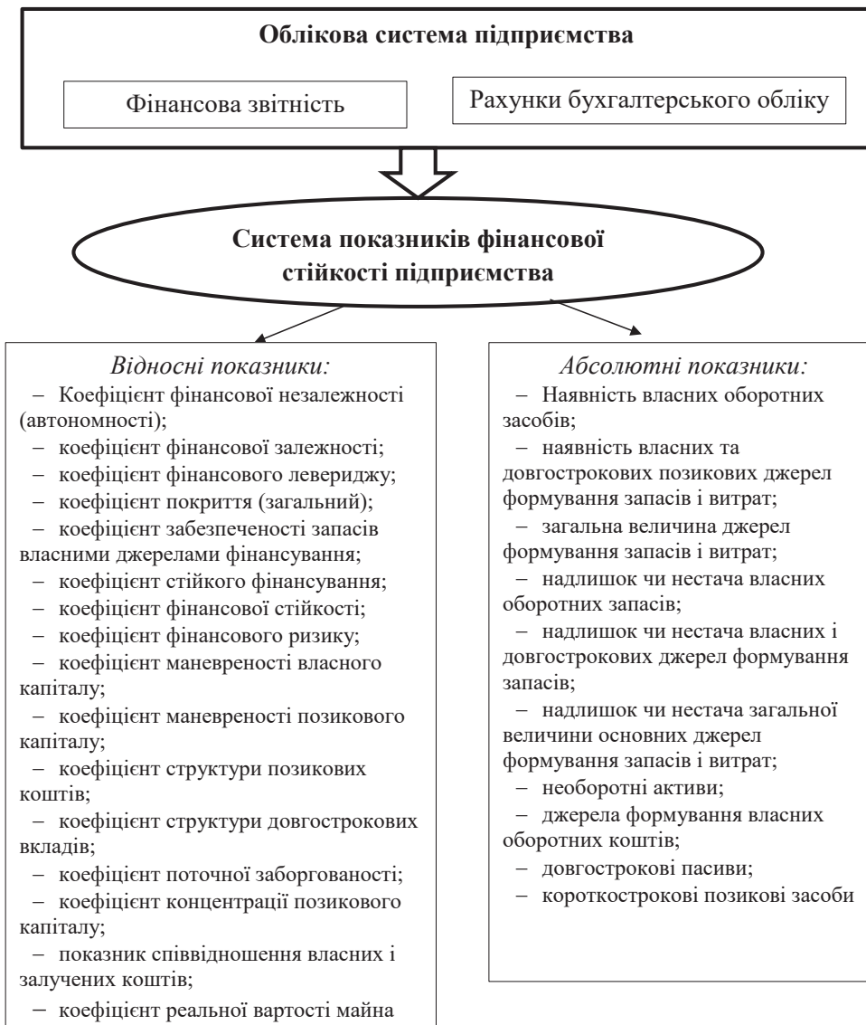
Рис. 2. Формування показників фінансової стійкості в обліковій системі підприємства

Важливу роль у моніторингу фінансової стійкості суб'єктів господарювання відіграє його інформаційне забезпечення. Зокрема, дані про власний капітал підприємства формуються на рахунках класу 4, про залучений – на рахунках класів 5, про