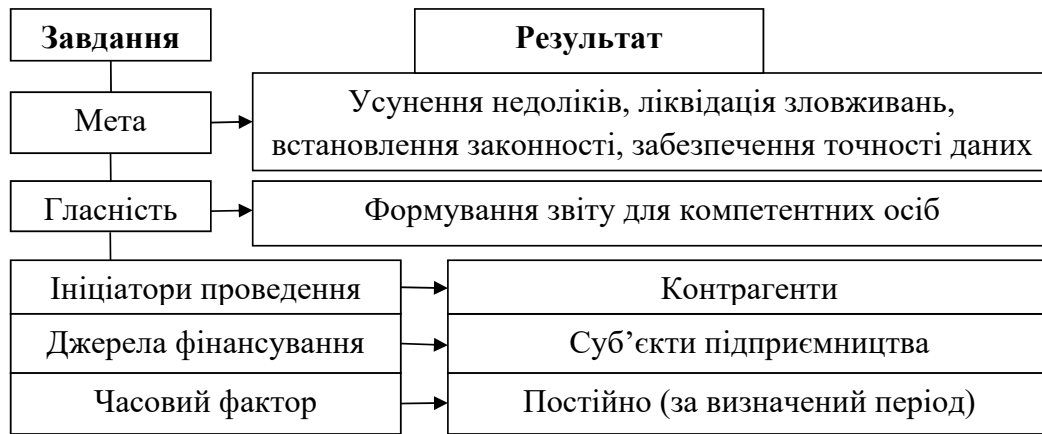
Рис. 2. Завдання аудиту та очікувані результати