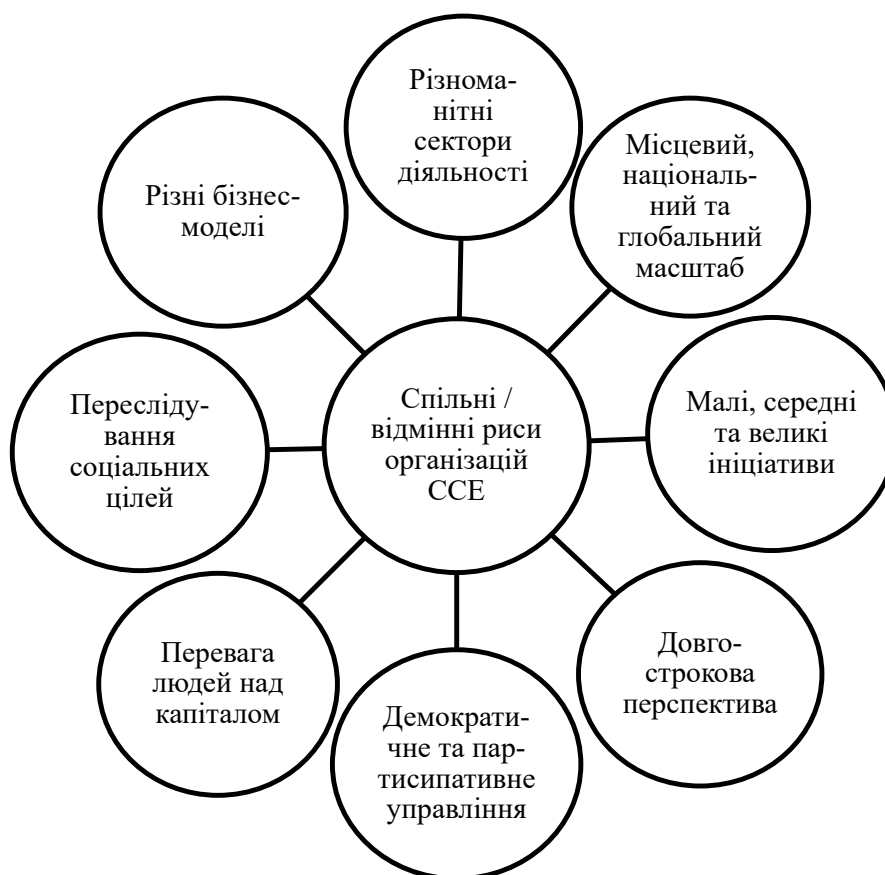
Рис. 1. Особливості соціальної солідарної економіки

За деяких обставин держава забезпечує вирішення проблем ринку, наприклад, у виробництві колективних товарів. Держава виробляє товари та послуги через державні підприємства, оскільки колективно погоджено, що для певних товарів і послуг жодна особа не повинна бути виключена з їх споживання через цінову систему, і тому ринок не є оптимальним рішенням (наприклад, залежно від країни – оборона,