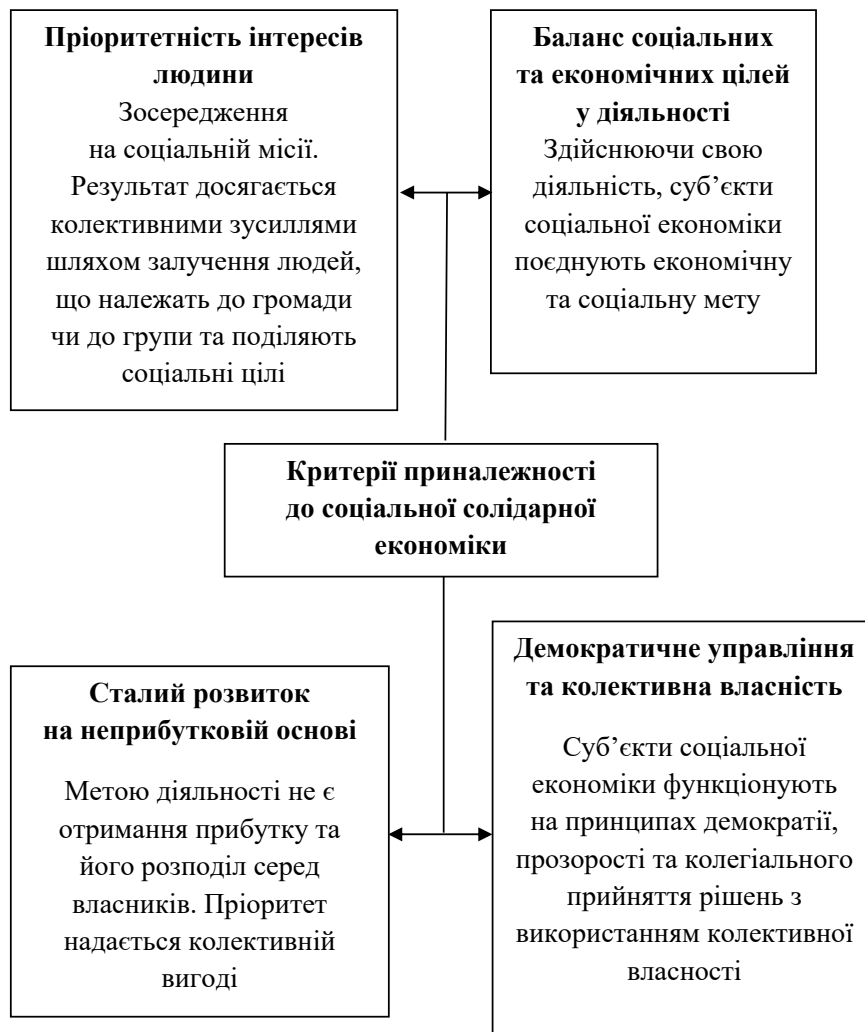
Рис. 3. Критерії, що визначають приналежність до соціальної солідарної економіки

На певному етапі концепція ССЕ отримала потужний розвиток і переросла в глобальні