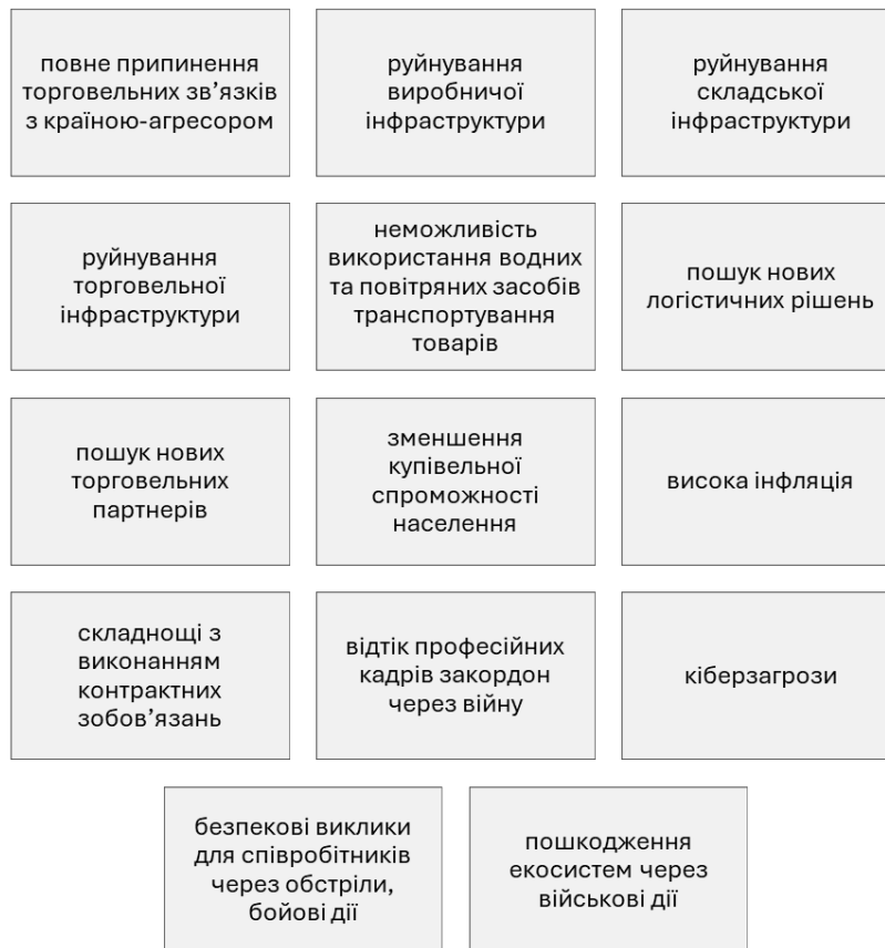
Рис. 1. Виклики повномасштабної війни для суб'єктів підприємницької діяльності в Україні